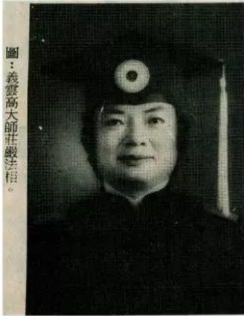
圖：義雲高大師莊嚴法相。

報日合聯原中華京 KIA HUA TONG NGUAN (SIRINAKORN)