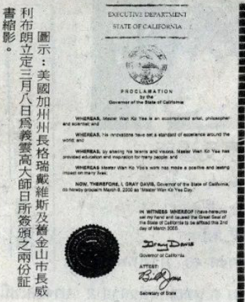
圖示：美國加州州長格瑞戴維斯及舊金山市長威利布朗立定三月八日為義雲高大師日所簽頒之兩份証書縮影。