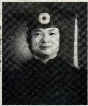
圖：義雲高大師莊嚴法相。