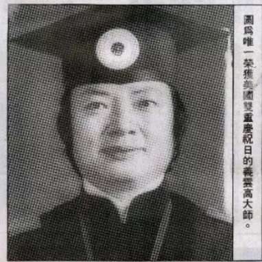
圖為唯一榮獲美國雙重慶祝日的義雲高大師。