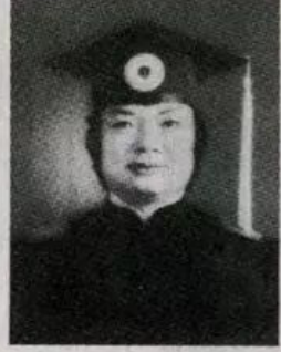
圖：義雲高大師莊嚴法相。

為表彰、讚揚義雲高大師在佛 學、哲學、藝術、科學、倫理道德 等全方面卓越的傑出成就，並對義 雲高大師為世界人類所作之偉大貢 獻致上最崇高的敬意，加州州長戴 維斯(GREY DAVIS)代 表州府於西元二千年頒定每年的三 月八日為義雲高大師日，舊金山 市布朗立定三月八日為義雲高大師日所簽頒之兩份證 書縮影。6P